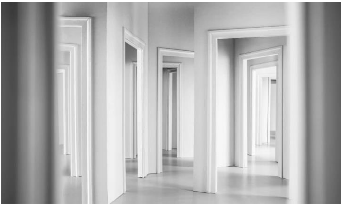
Untitled Doors, 2013