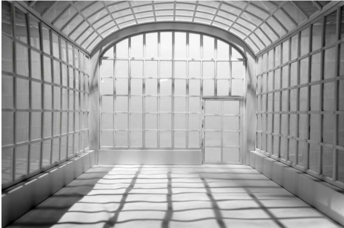
Untitled #7, 2013